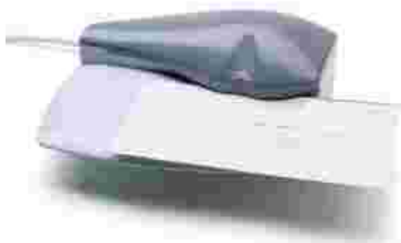
Mod.: PMA 200

Según nuestro volumen, elegiremos uno u otro modelo.