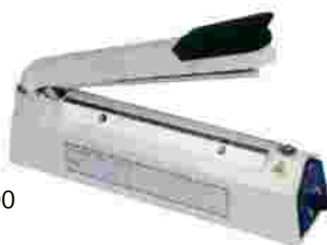
Mod. PMA 400