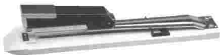
Mod. AREL 25 (Grapadora con largo especial)

Usa grapas de acero de la máxima dureza.