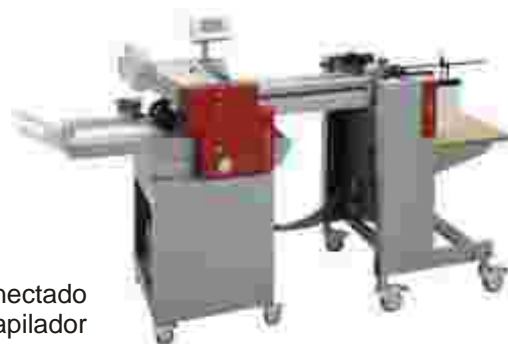
Módulo conectado con apilador