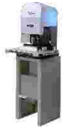
Mod. 290 (MESA)