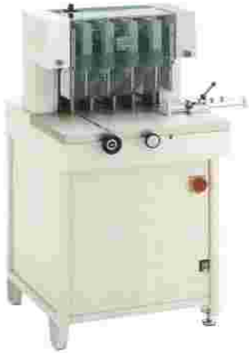
Mod. (ALIM. ASICA)

Seguros y de fáciles de manejar, estos taladros resuelven rápida y eficazmente sus trabajos.