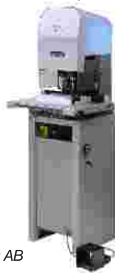
Mod. 290 AB